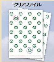
総会出席者全員に、一泉・泉丘校章マーク入りの落雁とクリアファイルがプレゼントされた。