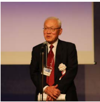
新谷会長の開会のご挨拶