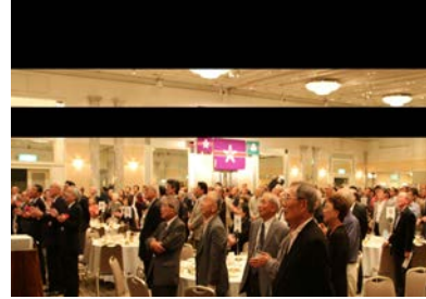
一中・泉丘の横断幕と会場