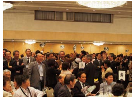
クイズ大会：各テーブルに配置した手製うちわの番号を挙げて解答いただきました。