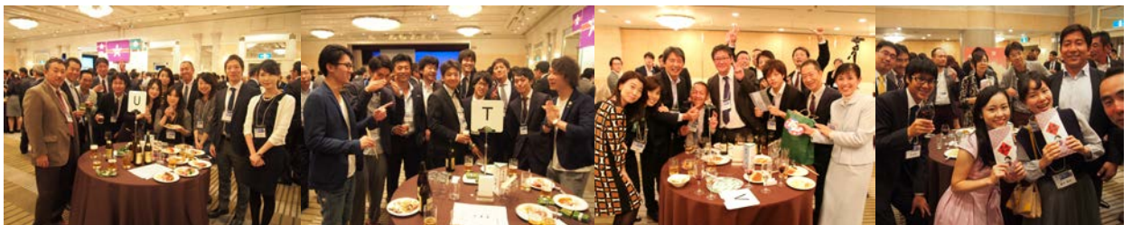
各テーブルでの盛り上がり