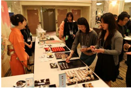
金沢の味コーナーでのおもてなし